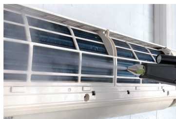
Pistolet de pulvérisation intelligent avec commandes à distance